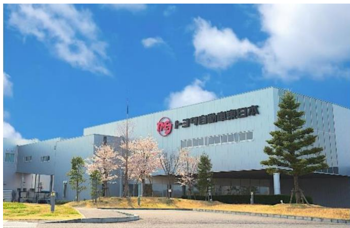
TMEJ 本社・宮城大衡工場

TAGAは、今後さらに再生可能エネルギー調達の可能性を探り、供給先の拡大を検討し、進めていく予定です。EJSは地域、行政と連携し、工場や事業所等から排出されるCO 2 をゼロにする取組みを進め、低炭素社会の実現に貢献していきます。